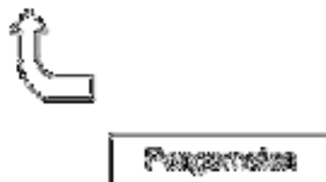
Gambar 1: Siklus Penelitian Tindakan Kelas

Instrumen penelitian adalah alat yang dapat digunakan untuk mengumpulkan data penelitian. Observasi ( siapkan blangko observasi) : Observasi merupakan teknik mengumpulkan data dengan cara mengamati setiap kejadian yang sedang berlangsung dan mencatatnya dengan alat observasi tentang hal-hal yang akan diamati atau diteliti. Dalam PTK observasi digunakan untuk memantau kegiatan guru dan memantau kegiatan siswa. Misalnya dengan mengamati dan mencatat setiap tindakan yang dilakukan guru dalam setiap siklus atau tindakan pembelajaran sesuai dengan fokus masalah. Tes (membaca) perbuatan/unjuk kerja. Dokumentasi berasal dari kata dokumen, yang artinya barang-barang tertulis. Data tersebut seperti gambaran umum sekolah, keadaan sarana dan prasarana, keadaan guru dan siswa dan struktur organisasi sekolah. dan Indikator keberhasilan penelitian tindakan kelas ini terdiri atas dua jenis, yaitu indikator hasil belajar dan indikator proses belajar. Berdasarkan indikator hasil belajar peneliti dikatakan berhasil jika terjadi peningkatan hasil belajar siswa setelah diterapkan Baca Tulis Alquran pada mata pelajaran Pendidikan Agama Islam. Apabila terdapat 65% siswa mendapat nilai minimal 70 sesuai dengan KKM (kriteria ketuntasan minimal) baca tulis al-qur'an surah Al-Mujadilah yang digunakan dalam pelaksanaan pembelajaran Pendidikan Agama Islam di sekolah SMPN 7 Sambas.