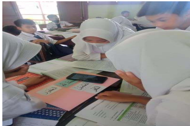
Foto Kegiatan Pembelajaran